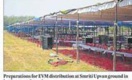
Preparations for EVM distribution at Susruti Upran ground in Lucknow on Saturday. MONTAQU

Security has also been ramped up across all polling stations. The administration is coordinating with law enforcement agencies to ensure law and order throughout the day. Adequate arrangements for drinking water, shade and seating have been made at each booth to keep