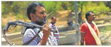
The guns of the big moustache men carrying them are missing from poll campaigns altogether.

In this region, guns are deeply integrated into local customs and the feudal society, with people often seen carrying them as a symbol of power machismo. But in this election, the power display is conspicuous by its absence in campaign