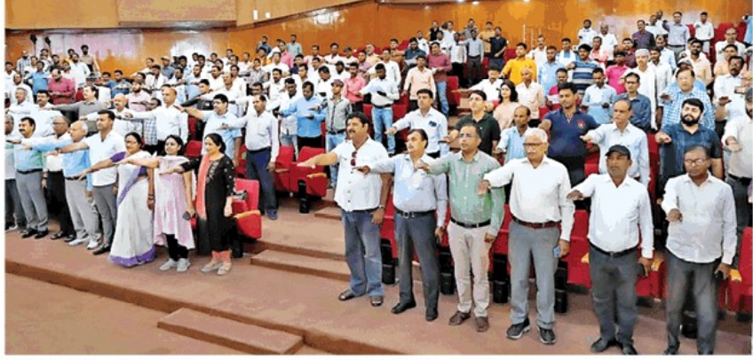
इंदिरा गांधी प्रतिष्ठान में आयोजित कार्यक्रम में मतदान करने की शपथ लेते लोग

मंडलायुक्त ने कहा कि जब भी चुनाव में कम मतदान होता है तो लोग चर्चा करते हैं कि शिक्षित समाज वोट डालने के प्रति उदासीन है। हमें साथ मिलकर इस सोच को बदलना होगा और 20 मई को होने वाले मतदान में पहले वोट करना होगा। रेजिडेंट वेलफेयर