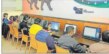
Social media platforms such as Facebook, X, and WhatsApp became battlegrounds for political discourse, with parties deploying targeted messaging, viral content, online campaigns, etc., to sway public opinion. PIC FOR REPRESENTATION